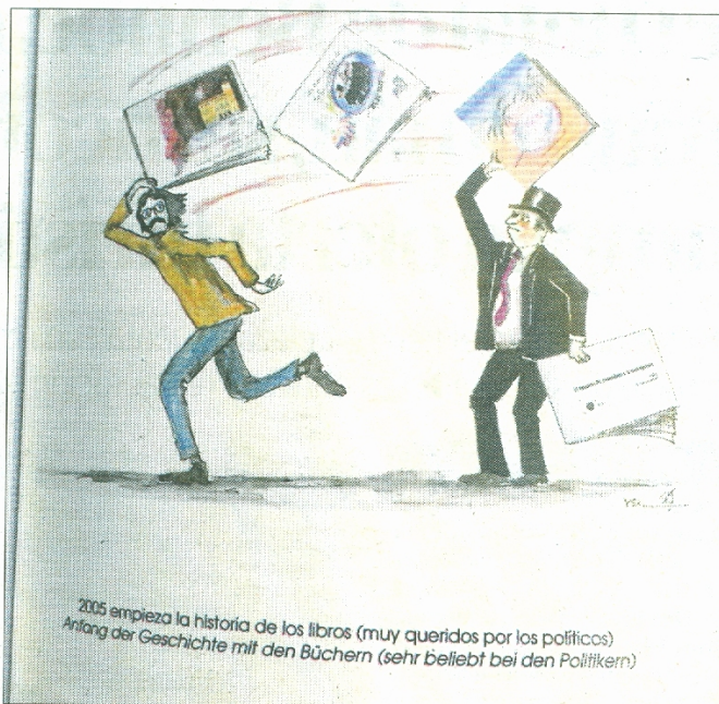
Uno de los dibujos que aparece en 'La otra biografía'.