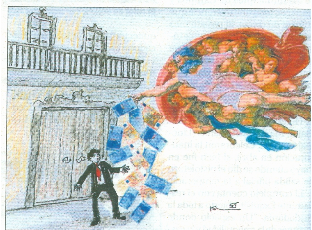
Dibujo inspirado en la noticia 'Matas ingresa 2 millones para evitar la subasta del palacete. ¿De dónde ha sacado el dinero?!'. RUDY SCHWIZGEBEL