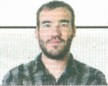
SES SALINES