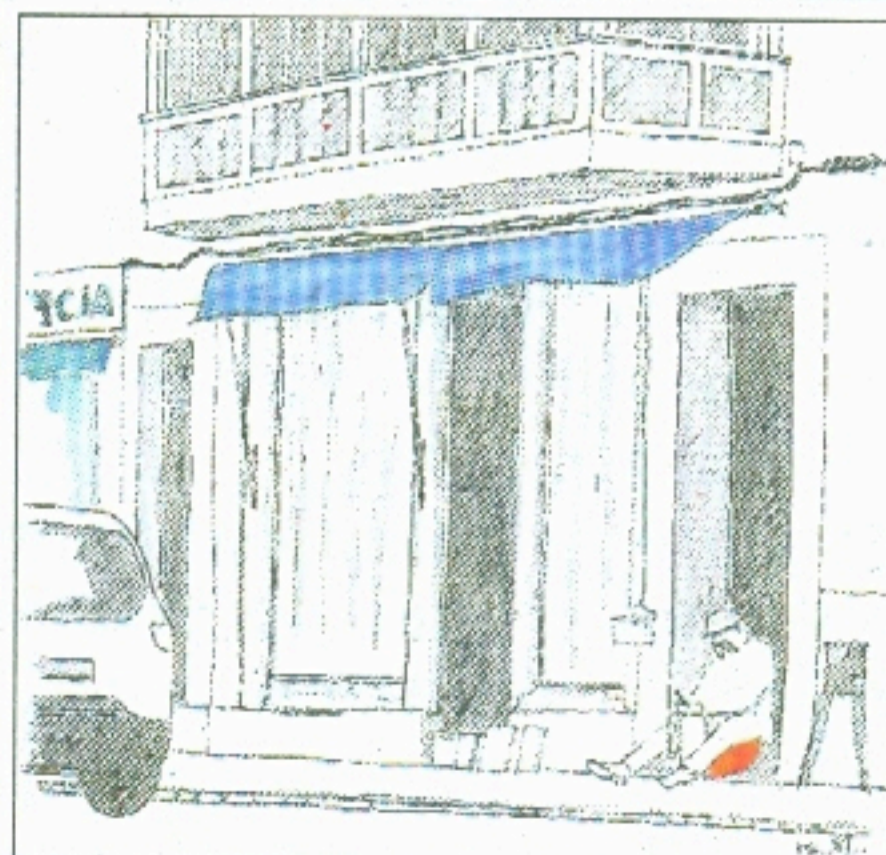
Varios dibujos del libro 'Cono Sur'. C. BUCHLI/R. SCHWIZGEBEL